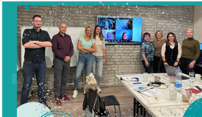
Среща на проекта в Нови Сад

Номер на проекта: 2021-1-R001-KA220-VET-000028118